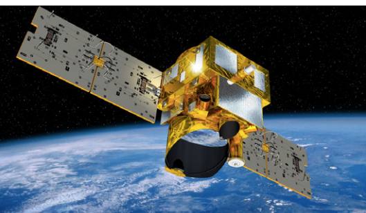
Le satellite MERLIN analysera le méthane à l'échelle globale