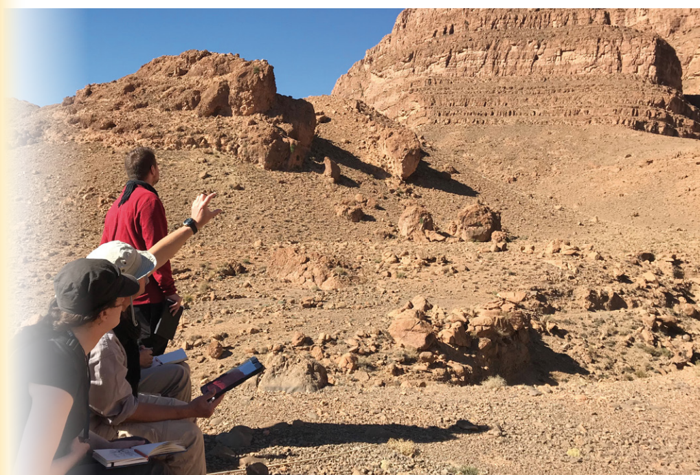
Stage au Maroc 2018 M2 Sciences de la Terre et des Planètes, Environnement